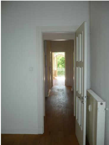
Flur – Blick Richtung Strasse