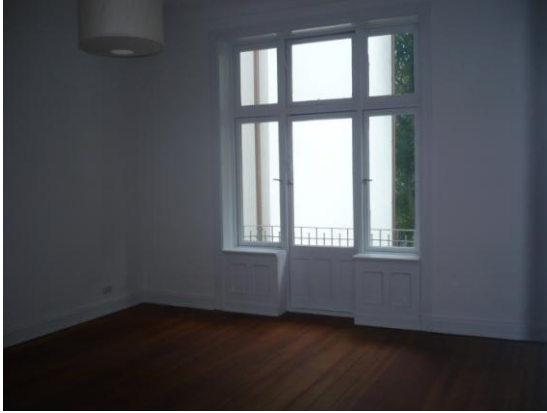
Schlafzimmer I mit Zugang zum Balkon