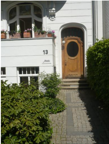
Haustür Böttgerstr. 13