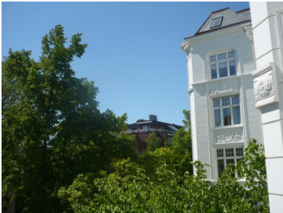
Blick vom Balkon nach Westen