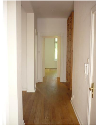
Flur – Blick nach rechts