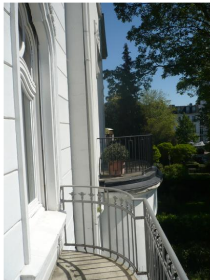
Blick vom Balkon nach Osten