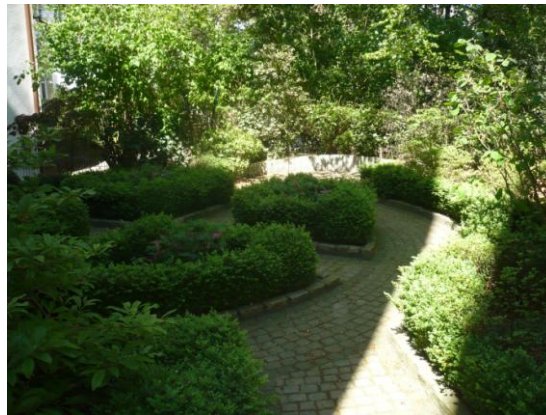
Blick vom Balkon in den Hintergarten