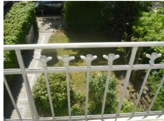
Blick vom Balkon in den Vordergarten