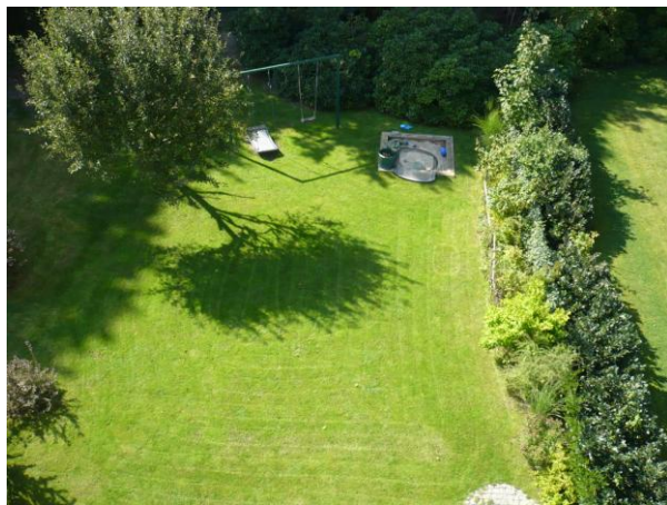
Blick vom Balkon in den Garten