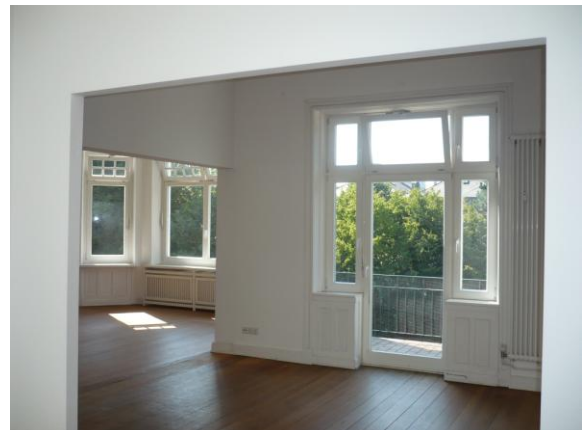
Zimmer vor Balkon