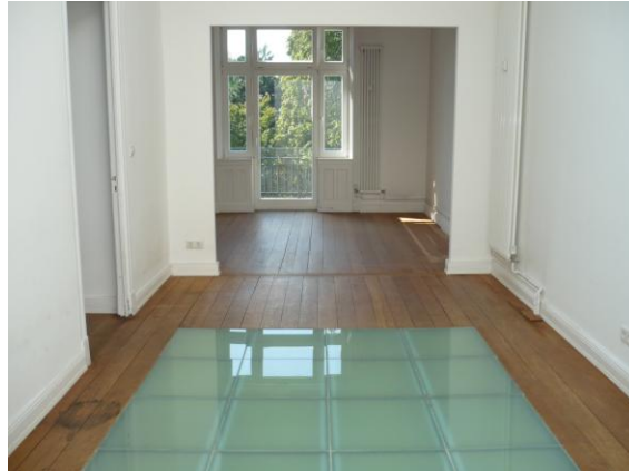
Blick vom Eßzimmer zum Balkon