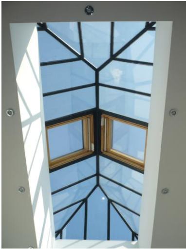
Glasdach über Eßzimmer