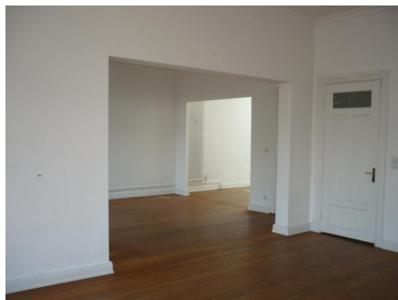
Blick vom Wohnzimmer Richtung Eßzimmer